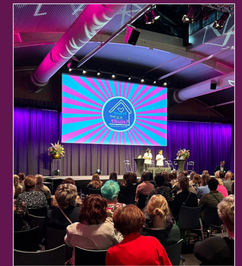
Het UKON-Lustrum Symposium op 4 april 2023 'Voel jij je thuis?'