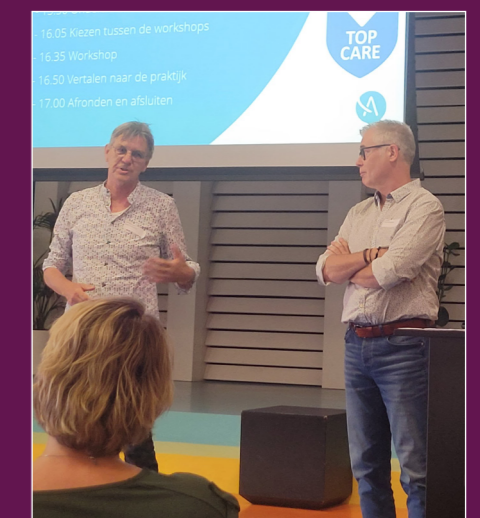
Het minisymposium op 19 juni 2023 'Samenwerken met naasten'

Tijdens de workshop 'Samenwerken met naasten' is meegedacht over de verschillende rollen die naasten in de zorg en behandeling van cliënten zouden kunnen vervullen. Een samenvatting van alle ideeën die tijdens de workshop naar voren kwamen is intern gedeeld. De aangedragen ideeën worden gebruikt om te kijken hoe we naasten tijdens de opname nog beter kunnen betrekken.